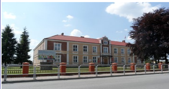
Nasza „jubilatka” obecnie wraz z nauczycielami