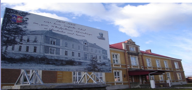
17 października 2008 r. obchodziliśmy 100- lecie.