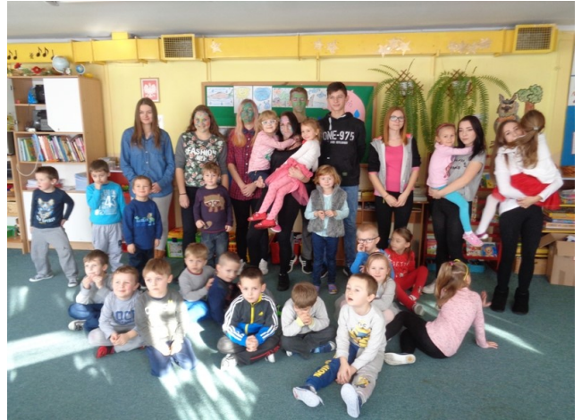
Wolontariusze w Miejskim Przedszkolu w Rudniku nad Sanem

Bogatym nie jest ten kto posiada, lecz ten kto daje.