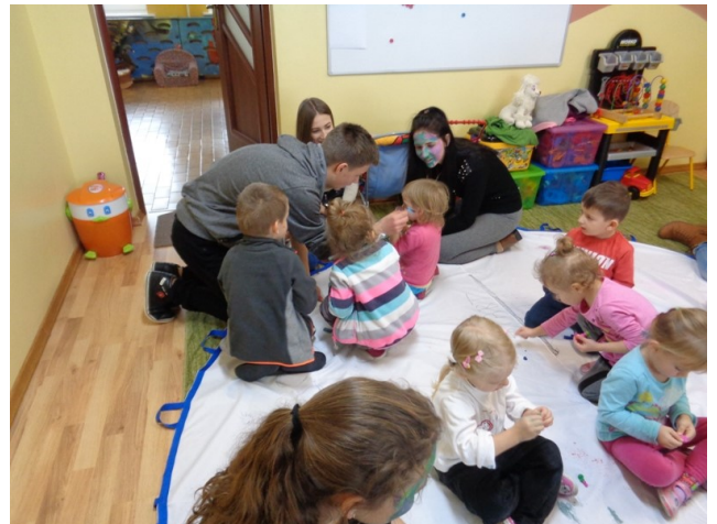
Wolontariusze w Ochronce w Rudniku nad Sanem