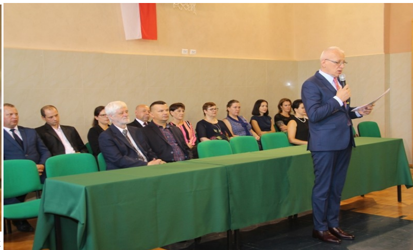
Kadra nauczycielska Zespołu Szkół im. gen. Władysława Sikorskiego