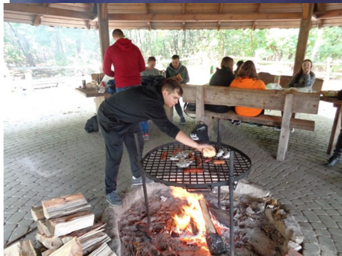
Całość jest czymś więcej niż sumą części