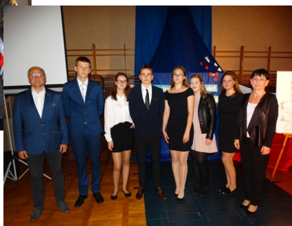
Uczestnicy akademii z opiekunami

11 listopada jako Święto Niepodległości ustanowił przedwojenny rząd Polski. Władze II Rzeczypospolitej chciały upamiętnić objęcie władzy w Warszawie przez Józefa Piłsudskiego. 10 listopada 1918 Józef Piłsudski powrócił do Polski, a 11 listopada Rada Regencyjna przekazała mu naczelne dowództwo nad podległym jej Wojskiem Polskim. Odzyskanie niepodległości składało się z wielu etapów. Jesienią 1918 roku miały cztery lata od rozpoczęcia I wojny światowej. Stało się jasne, że Niemcy i Austro-Węgry niedługo upadną. Polska i inne kraje regionu zyskały niezwykłą szansę na zdobycie niepodległości.