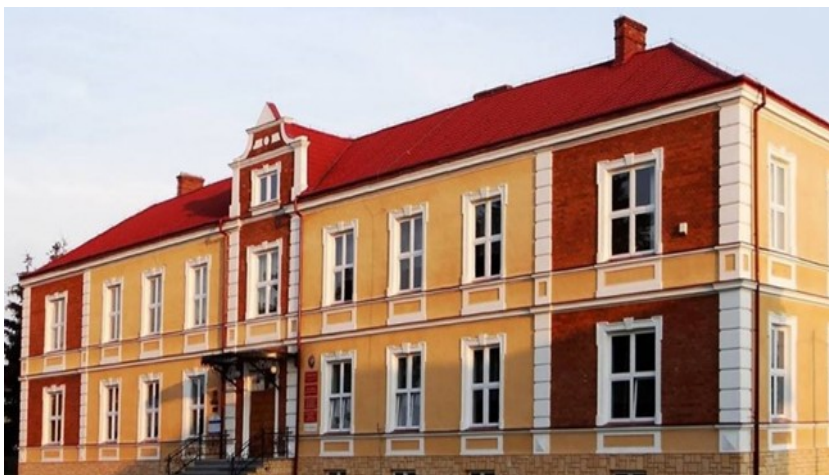
Budynek naszej szkoły

U nas w szkole z pewnością nie macie się czego obawiać. Jesteście otoczeni wspaniałymi nauczycielami oraz przyjacielsko nastawioną społecznością uczniowską.