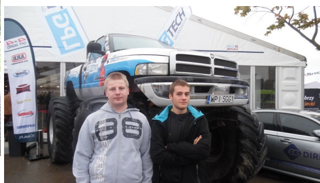
Targi Motoryzacyjne w Warszawie