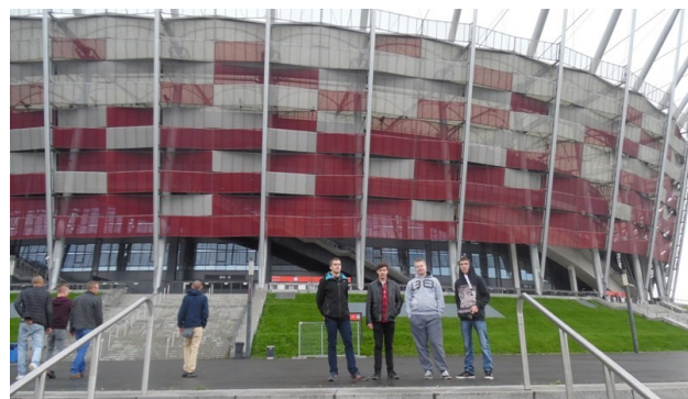
Uczniowie klasy IV w Warszawie