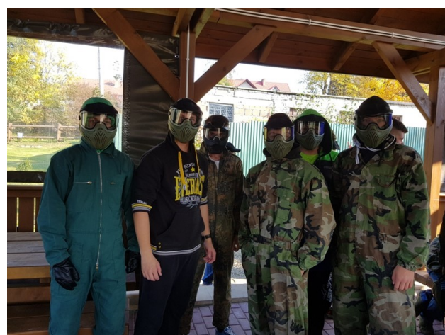
Paintball klasy II